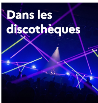
Dans les discothèques

Depuis le 10 décembre, il est interdit de danser dans les bars et restaurants (ERP de type N) et les discothèques (ERP de type P) sont fermées. Décret