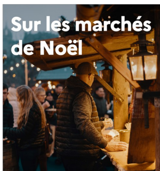
Sur les marchés de Noël

est autorisée uniquement dans des zones dédiées à la consommation et soumises au passe sanitaire. Toute consommation de boisson ou nourriture doit s'effectuer dans ces espaces, et non en déambulant sur le marché.