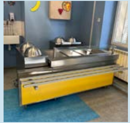
LES ÉCOLES Pages 7 - 8