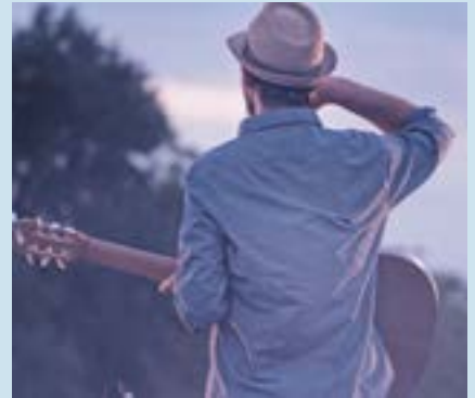
CULTURE Pages 10 - 11