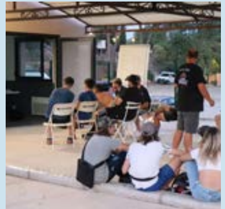
CCAS Pages 14 - 16